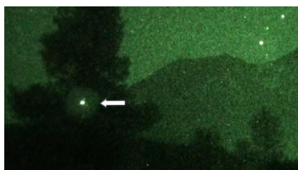
Mt. Shasta - CE-5 Contact training - An ET craft in front of a tree