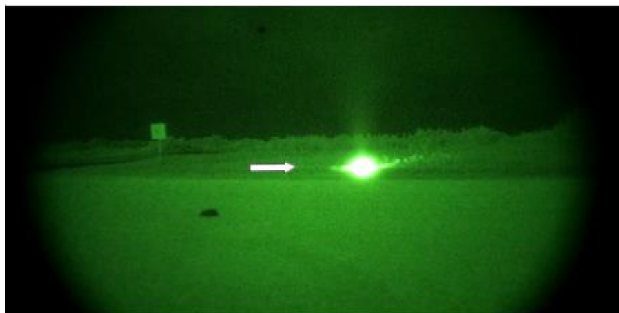
砂上で突然出現したET宇宙機 - マルコ島 - 2011年