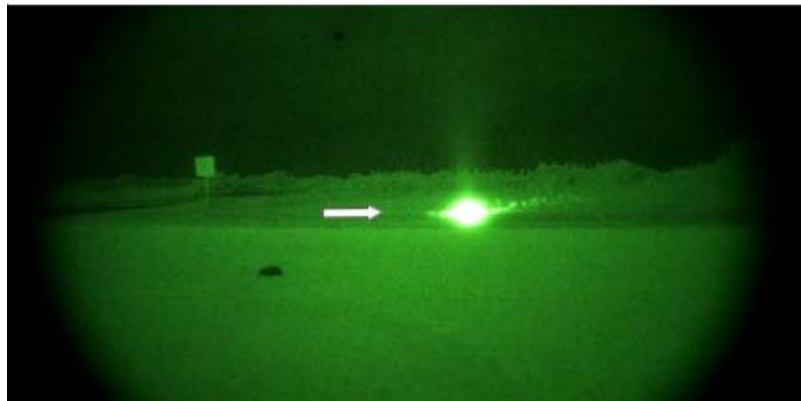
A craft bursting into view on the sand - Marco Island - 2011