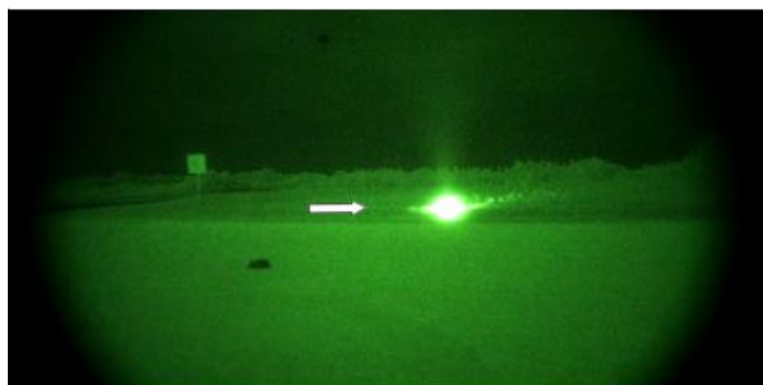
マルコ島での野外調査 - 2011年