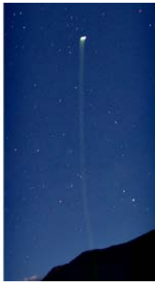
Crestone Expedition - 2011