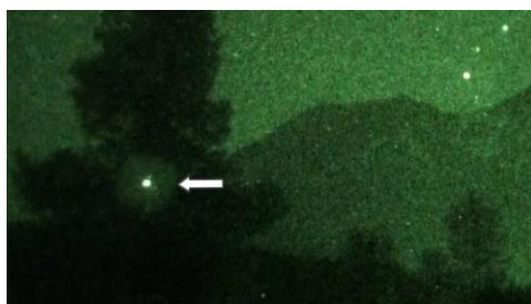
2011年シャスタ山のCE-5調査で撮られた写真

“これらの光体は木々を照らしていました。赤い宇宙機が1機飛来し、止めてあったトラックの近くの木の中で紛れもなく静止しました。それからさらに数機が北と西からやってきました。これらの光体は宇宙から私たちのいる場所にやってきた、白く輝く、動きの速い宇宙機でした。．．．．数機の宇宙機が私たちの瞑想に加わるために到着し、そのうちの何機かはシャスタ山から出現しました。．．．．それは流れ星を思わせましたが、夜空を横切らず、上昇しました”