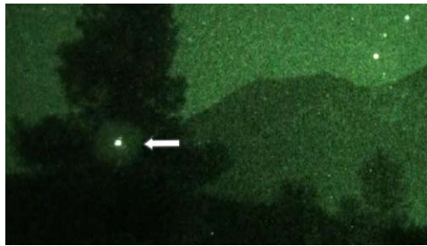
A photo from the CE-5 Expedition at Mt. Shasta 2011

"These lights were illuminating the trees. A red craft came in that actually stayed in the tree near our parked truck before several more came in from the north and west. These lights were brilliant white, fast-moving craft coming from space to our site.....Several craft arrived to join in the meditation and some of them emerged from Mt. Shasta.... It reminds me of a 'falling star' but goes up, rather than across the sky."