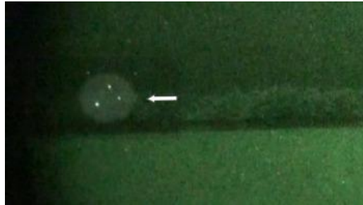
マルコ島コンタクト調査旅行 - 2012 年

どうぞ www.SiriusDisclosure.com/expeditions で日程の詳細を読み、お申し込みください。