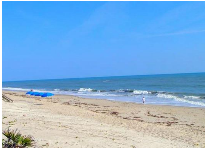
コンタクト調査 - 2015年1月 - 米国フロリダ州東岸