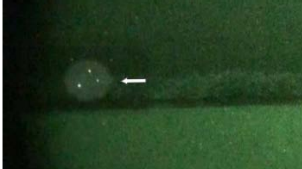
Marco Island 2011

"It was more than just a retreat to experience ETs. Our work there with consciousness was not just for contact. It is a fundamental part of the universe. When communing with nature, it brings a deeper oneness with mother earth. In addition, knowing consciousness is eternal is healing. .... Making a connection with other people in the universe and being a part of an infinite community is an enriching and heartwarming experience." - notes from T. M. from April 2014 AZ Expedition