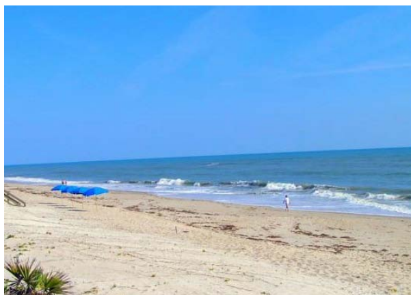
Expedition - January 2015 - East Florida Coast USA